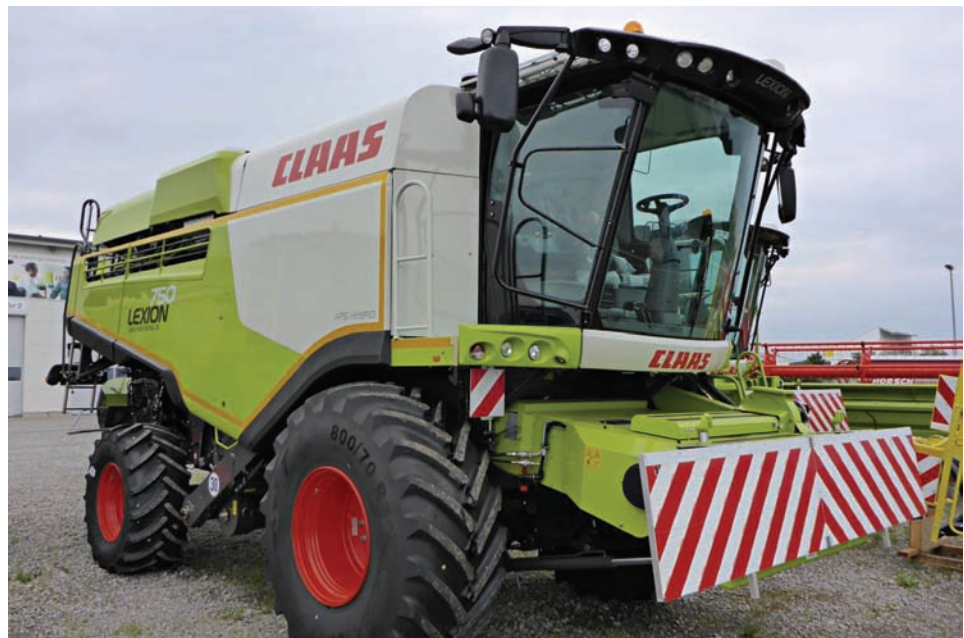
Die Radlast voll beladener Mähdrescher beträgt bis zu 12 Tonnen!

Außerdem zerstören schwere Ackergeräte die Regenwurmgänge und verdichten den Boden dabei so, dass Regenwürmer immer schwerer und durch den Unterboden oft gar nicht mehr durchkommen, trotz ihrer genialen Fress- und Pumptechnik beim Graben. Lehmitz et al. (2016) 2 betonen: „Bodenverdichtung reduziert nachweislich die Grabaktivität von Regenwürmern.“ Und Ehrmann (2015) 4 schreibt: „Ein stark verdichteter Unterboden wird daher selbst bei einer hohen Regenwurmpopulation sehr lange (vermutlich >100 Jahre) in den meisten Bereichen verdichtet bleiben“, weil die Würmer nur sehr spärlich wieder darein eindringen. In Baden-Württemberg zeigen 1/3 aller untersuchten Unterböden (nicht nur Ackerböden) keinerlei Spuren von Regenwurmmaktivität (mehr), ein weiteres Drittel nur (noch) sehr geringe.